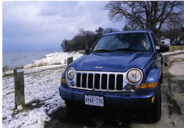
La charmante petite ville de Niagara-on-the-Lake est située au bord du lac Ontario.

Le verglas rend les routes parfois dangereuses, notamment sur le réseau secondaire qui est rarement sablé.