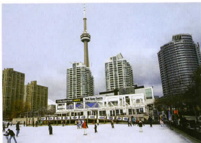
Toronto, plus grande ville du Canada de par sa population et son activité économique, bien que la capitale fédérale soit Ottawa.