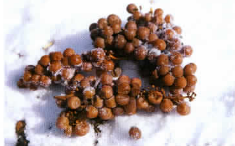
L'Ontario, une des plus grandes régions viticoles du monde, produit le célèbre vin de glace.