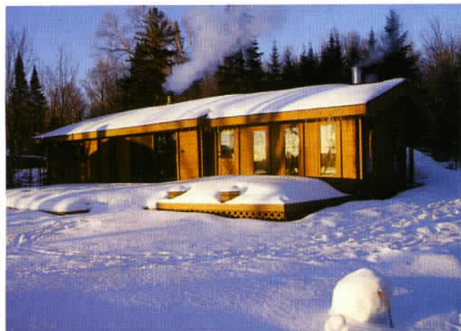
Voyageur Quest propose le «Nippising cottage», chalet situé en bordure du splendide lac Kawawamog, au nord-ouest du parc Algonquin.

chaque cépage, un contenant qui change réellement le goût du contenu. Les bâtisses de Queen Street à Niagara-on-the-Lake offrent, quant à elles, une superbe expression de l'architecture locale. Ici, pour séjourner, nous vous recommandons Riverbend Inn, une déclinaison canadienne de nos Relais et Châteaux. Des chambres grand confort, toutes avec cheminées, conjuguées à un restaurant raffiné offrent d'une excellente carte des vins issus, pour certains, du propre domaine de la maison :