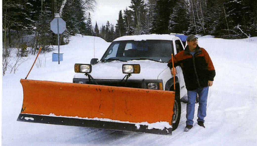
Le Canada apparaît à l'évidence comme un pays d'automobilistes. Le réseau routier est excellent et bien entretenu. Durant la période hivernale, les chasse-neige dégagent les routes même dans les endroits les plus reculés.