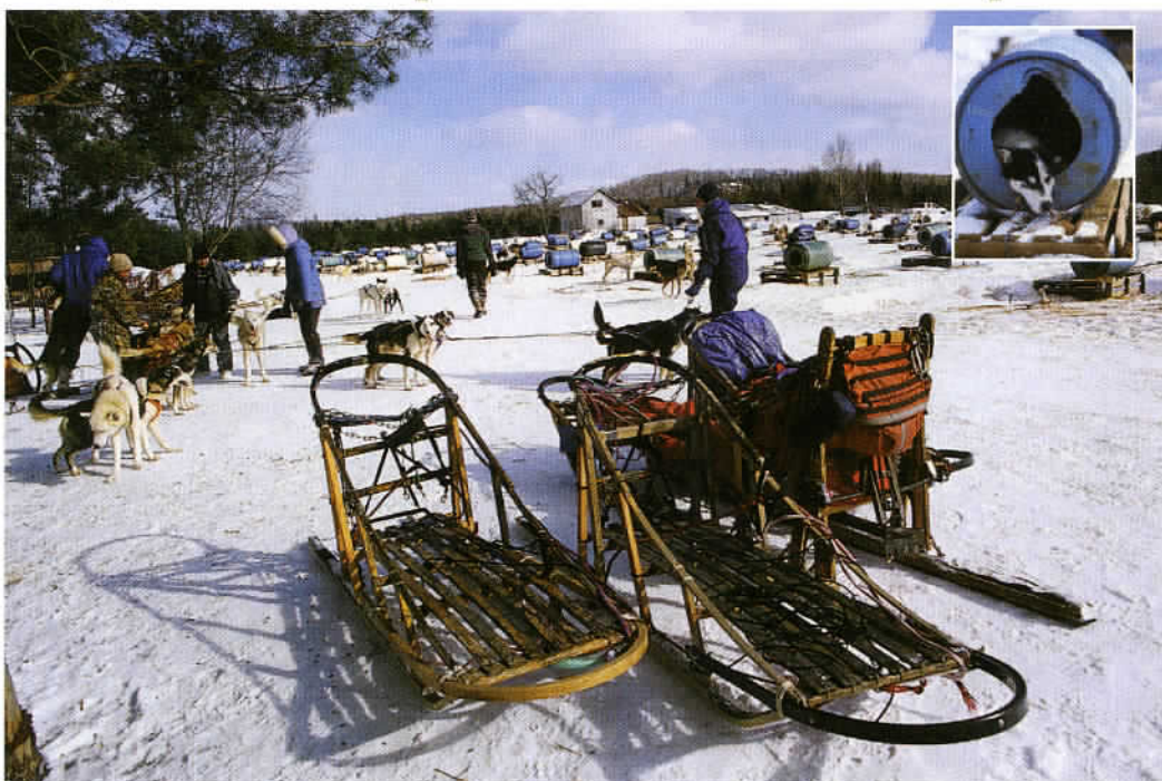
Au départ de South River, des randonnées inoubliables en chiens de traîneaux (dogsledding trips) sont organisées à la découverte du parc Algonquin, le plus ancien – fondé en 1893 – et le plus célèbre de l'Ontario.

chaque année. Beaucoup d'entre eux ont d'ailleurs toujours en mémoire Marilyn Monroe dans «Niagara», un film désormais mythique, tourné ici en 1953 par Henri Hathaway. L'autre point d'intérêt majeur de la région se trouve dans les vignobles autour de la charmante bourgade de Niagara-on-the-Lake, à 20km en amont des Niagara Falls, par la Niagara Parkway. Des vignes dont les grappes produisent 80 % du vin canadien, parmi lesquels le fameux vin de glace, un délicieux breuvage jaune et liquoreux élaboré exclusivement en Allemagne, en Autriche et en Ontario, seuls à maîtriser son processus de vinification. La meilleure adresse de Niagara-on-the-Lake où déguster et acheter ce vin précieux, entre autres bouteilles, est sans nul doute Inniskillin. Un bel établissement ouvert toute l'année dont les vignes et les vins ont remporté quantité de prix nationaux et internationaux. Son créateur ayant même inventé un type de verre dédié à ►►