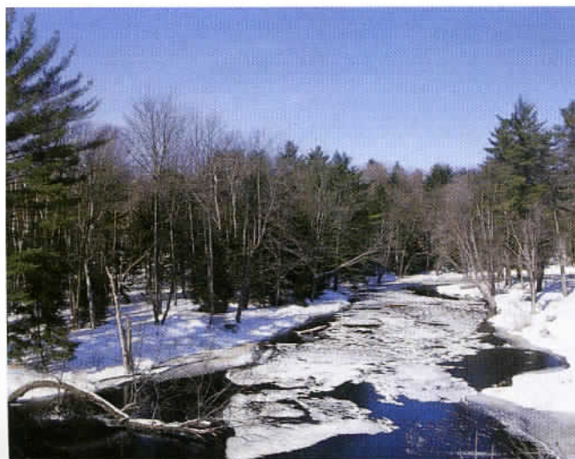
Cette province canadienne, réputée à juste titre pour son environnement préservé et la beauté de ses paysages, possède d'innombrables lacs et cours d'eau.

Le nord, plus sauvage, faiblement peuplé, contraste avec les terres fertiles du sud et les bords du lac Ontario où l'on trouve Toronto, capitale de la province la plus riche du pays.