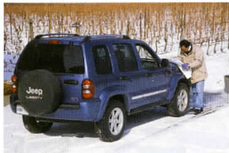
Autour de Niagara-on-the-Lake, on trouve 50 domaines vinicoles, dont Inniskillin.